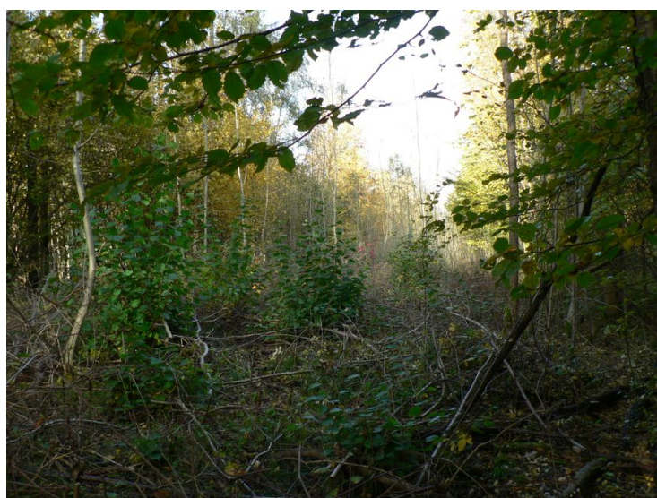
Des parcelles en voie de reboisement pour assurer la biodiversité

Le projet Forestor, c'est assez simple en fait. Un jour, je suis tombé sur l'interview d'un chercheur britannique qui avec son laboratoire a réussi à déterminer de façon très précise les parcelles qui sont encore disponibles sur notre planète pour éventuellement être remises en forêt. Et il est arrivé au constat que si l'on se met à planter des forêts à un bon niveau, on va pouvoir redescendre à des niveaux acceptables en matière de CO 2 . On ne peut pas dire qu'on va refroidir la planète, mais ça veut dire qu'à l'horizon de 25 ou 30 ans, on pourrait stabiliser les choses et éviter de dérégler la planète définitivement en matière de climat.