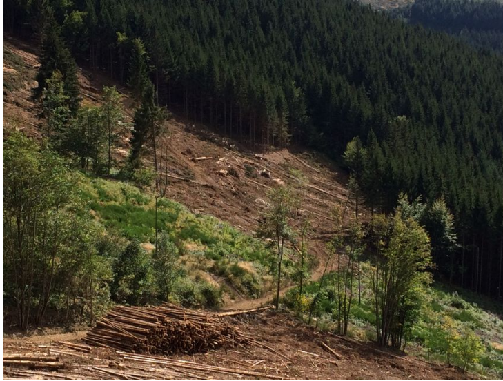
Secteur forestier dans le Pilat

France Bleu Saint-Etienne Loire est à vos côtés pour vous accompagner pendant la période de déconfinement. Chaque jour, à 7h17, votre radio s'intéresse à une entreprise emblématique de notre région. Comment se porte-t-elle ? Quels enseignements tire-t-elle de cette pandémie de coronavirus ? Comment se projette-t-elle dans l'avenir ?